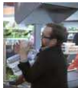
Un spot humoristique : avec ou sans les mains ?

Le lavage des mains permet de limiter la propagation des virus saisonniers. A l'occasion d'une campagne télévisée sur ce thème, l'Inpes rappelle d'autres gestes à adopter : éviter les contacts rapprochés avec des personnes malades, se couvrir la bouche avec un mouchoir ou le coude en toussant ou éternuant, plutôt qu'avec les mains... Une brochure sur la bronchiolite et une sur la diarrhée concernent la prévention spécifique à l'égard des nourrissons.